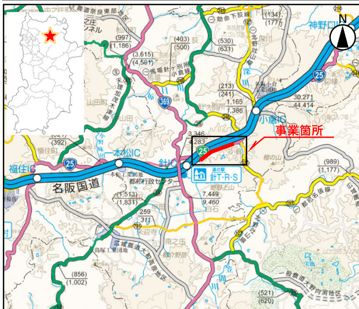
「奈良県道路網図(R5JHs506)を転載」